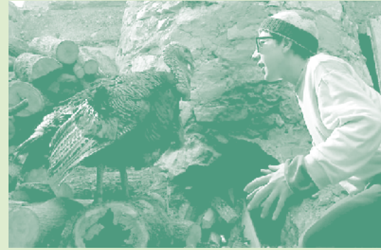
Le Temps des gitans