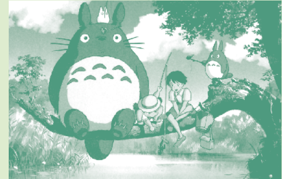
Mon voisin Totoro