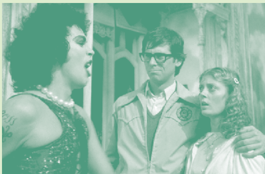
The Rocky Horror Picture Show

Séances suivantes : 4€ tarif plein | 2€ moins de 12 ans