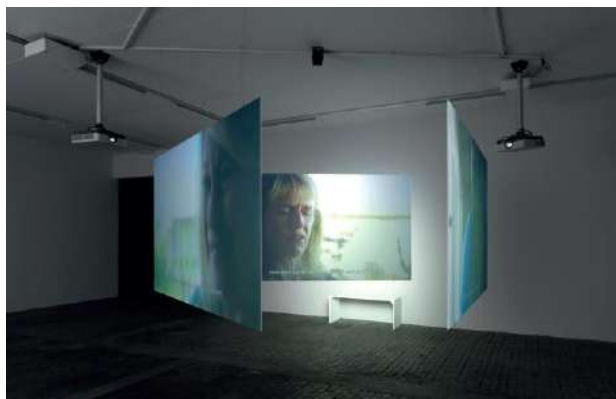
Actuellement: installation vidéo