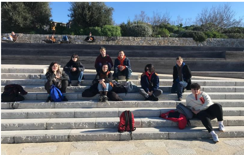
Workshop Love Janvier 2022 - Marseille

15-16 Janvier 2022. Théâtre Massalia à Marseille, WORKSHOP LOVE – 2 jours et 9 personnes invité·es (artistes, médiatrices, influenceuses...), en non-mixité choisie. La question soulevée pour ce workshop Love est : avec quelle idée de l'amour me suis-je construit·e ?